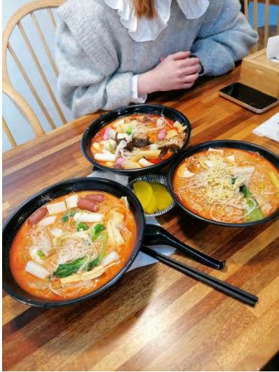
Традиционный китайский суп Маратан, ингредиенты в который можно добавлять по собственному желанию