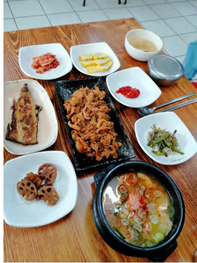
Традиционное корейской блюдо из свинины - Пульгоги